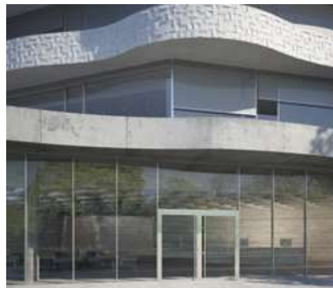
Schüco Deur ADS SimplySmart, projectbouw Schüco Porte ADS SimplySmart, bâtiments commerciaux

Met dit innovatieve deursysteem zet Schüco een nieuwe standaard voor aluminium deuren. Schüco ADS SimplySmart verenigt designgerichte architectuurooplossingen in de woningbouw en project specifieke vereisten in één universeel systeemplatform. Daardoor zal bij deze deurseries bijvoorbeeld geen onderscheid meer bestaan tussen standaard en HD (Heavy Duty)-deuren.