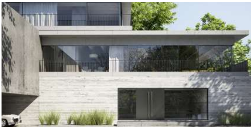
Schüco Deur ADS SimplySmart, hoogwaardige woningbouw Schüco Porte ADS SimplySmart, bâtiment résidentiel supérieur

La nouvelle plateforme en aluminium offre des solutions de système innovantes pour relever les futurs défis