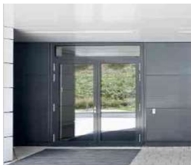
Schüco Aluminium Deursysteem ADS 75.SI Système de Porte Schüco ADS 75.SI