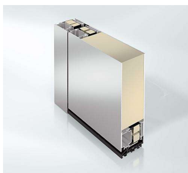
Schüco Deur ADS 75.HS Porte Schüco ADS 75.SI